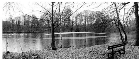
Afb. 2, Frederic Geurts, voorstel voor ingreep in Schildepark, collage, 2003.

De werkwijze van Frederic Geurts, die zijn productie meestal laat afhangen van opdrachten, is er wellicht verantwoordelijk voor dat de